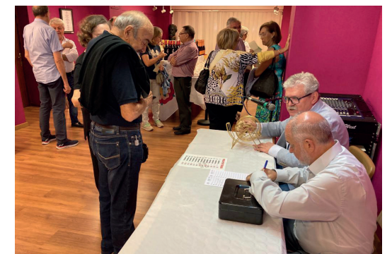
Diversos moments de la celebració de la Rifa a la nostra entitat.