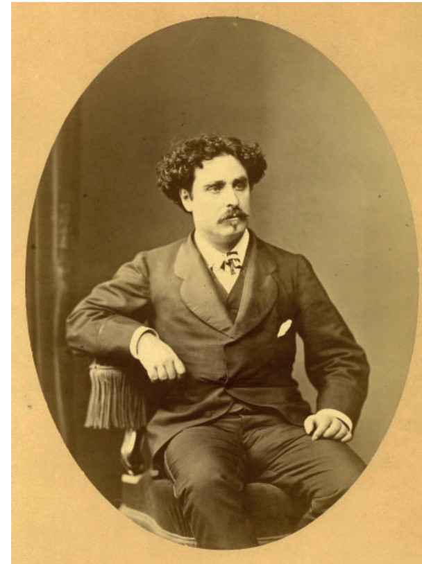
Una imatge de Marià Fortuny d'autor desconegut. Núm. reg.: 34415

Com vostès saben Marià Fortuny Marsal va néixer a Reus el 1838 i va morir a Roma el 1874. Fou el pintor amb més projecció internacional de l'art vuitcentista català i un dels artistes més cotitzats del seu temps. La indubtable qualitat de les seves obres el situen en un lloc d'honor de l'art europeu del segle XIX. Disortadament, quan començava a allunyar-se dels imperatius comercials i a realitzar una obra més personal i lliure, una mort prematura