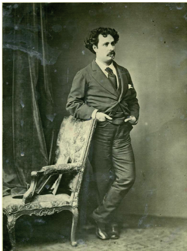
El pintor reusenc, en una altra fotografia.