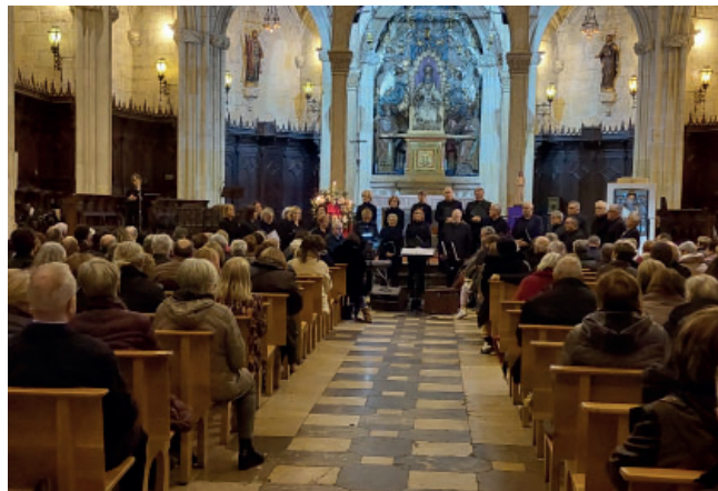
Un moment del concert celebrat a la Prioral de Sant Pere