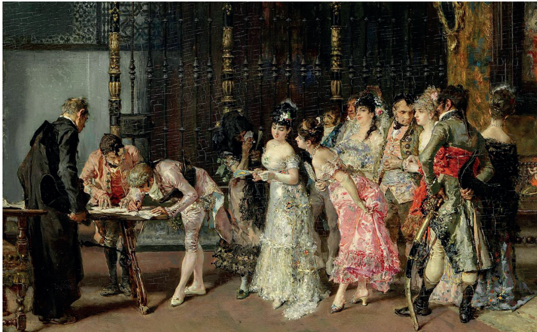
Fragment de l'obra "La Vicaria"

tat i imperícia, inevitable atesa l'edat de l'artista, però que ja prefiguren algunes de les virtuts que més endavant desenvoluparia al llarg de les etapes següents, tot i que encara no s'albira la dimensió de la seva genialitat.