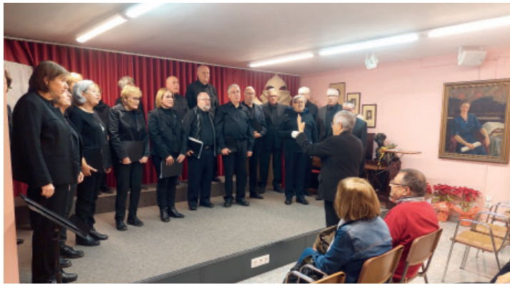
Imatge de l'actuació a la seu del Centre d'Amics de Reus

El concert de Nadal tradicional del nostre Cor va escaure enguany en diumenge, dia 18 de desembre, i el seu marc va ser, com també és habitual, la Prioral, una Prioral vestida de gala amb una entrada magnífica