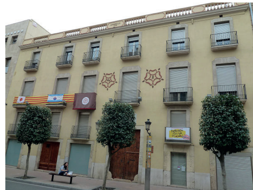
Façana de la Casa Boella

En general, la seva producció inicial està constituïda per obres menors, influïdes pel mestre, encara amb una certa tosque-