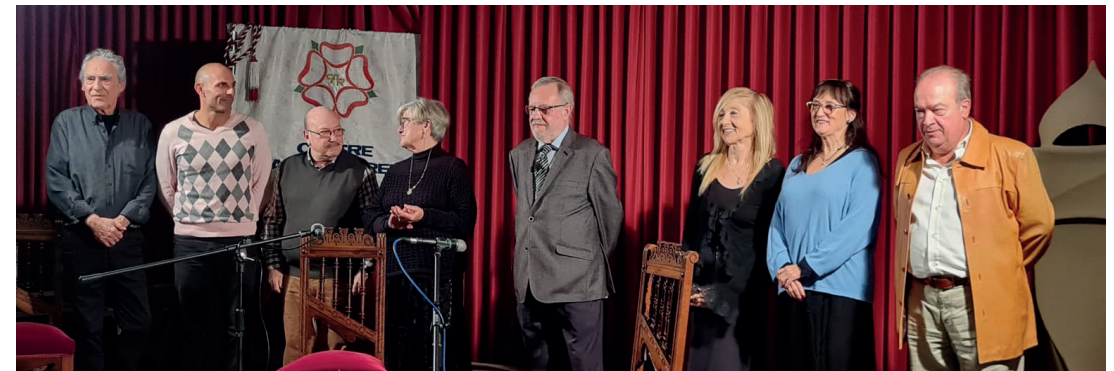
El Grup de Lectura de Teatre, en la seva estrena.

Nova oferta per als socis i sòcies de l'entitat i de nou a l'abric del món de la cultura. Una iniciativa d'Enric Tricaz ha vist la llum aquest darrer trimestre amb la creació del Grup de Lectura de Teatre del Centre d'Amics, o grup de teatre llegit. El forma el Grup de Lectura i Declamació del Centre, amb la coordinació d'en Tricaz.