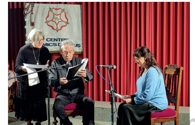
Un moment de l'actuació del col·lectiu.