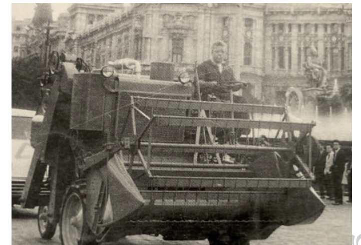
Màquina recol·lectora desfilant per Madrid.