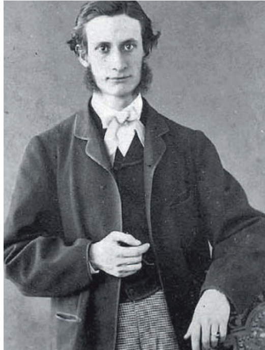
Josep Xifré i Casas, primer president de la Caja de Ahorros y Monte de Piedad de Barcelona, l'any 1808.

Els “enginyers” eren uns elements bàsics a les colònies per a la producció del sucre de la canya de sucre. Eren unes màquines o artefactes de grans dimensions, de fusta, molt pesats, amb grans cilindres que es feien servir per moldre la canya. Eren difícils de dur, molt perillosos, que requerien per utilitzar-los de gran quantitat de mà d'obra i que produïen nombrosos accidents. El treball