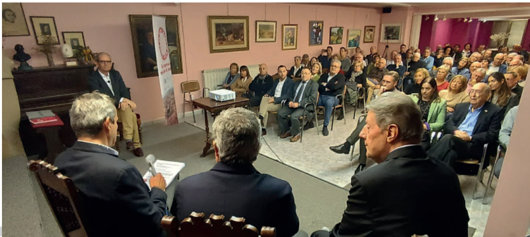
El públic va desbordar la sala d'actes.

"El que va començar com una indústria a nivell local amb el temps es va anar expandint"