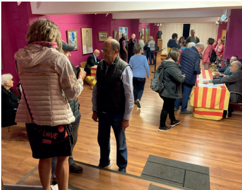
Un altre moment de la celebració de la rifa.

safates i safates de panellets i confitura i un ampli assortit de begudes, que anaven des del moscatell, el vermut, el licor d'arròs o el whisky, entre molts d'altres. Propostes per a tots els paladars i un sorteig continuat matí i tarda sota el clàssic crit de 'Va bola!', que s'entona quan aquesta comença a rodar pel bombo i hi ha temps per demanar un número.