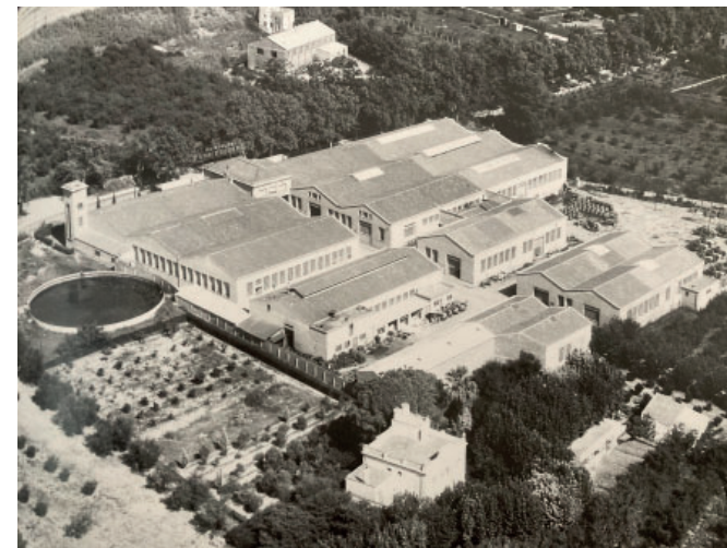
Vista aèria de la fàbrica en 1968.