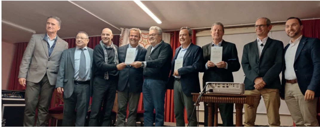
Foto de família dels participants i organitzadors de la sessió dedicada a JUBUS.