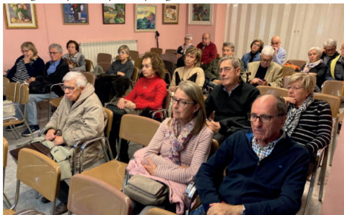
Imatge del públic que respongué a la cita.