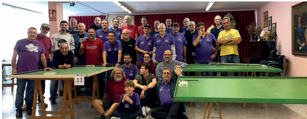
Foto de família de part dels participants a l'Open Reus.

El 2023 ha resultat ser un gran any d'activitat a l'Associació Reusenca de Futbol Botons (ARFB), entitat adscrita al Centre d'Amics de Reus. Més enllà de les competicions clàssiques (la Lliga i la Copa), s'ha aconseguit organitzar moltes competicions tal i com s'ha vist en resums anteriors. Després d'un tercer trimestre ple de torneigs del circuit català celebrats arreu del territori, els últims tres mesos de l'any no van ser menys i amb el mateix ritme competitiu que els mesos anteriors, tanquen l'any 2023 amb cinc diades botonaire esplèndides.