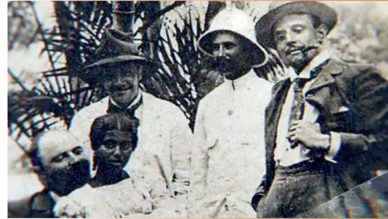
Imatge d'un negrer amb els seus esclaus.