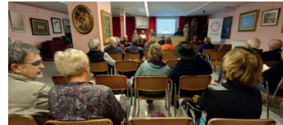
Imatge del públic assistent a l'acte.

nitiva, catorze poemes que ens faran reflexionar sobre la nostra pròpia existència i si realment sabem, com a societat, cap a on