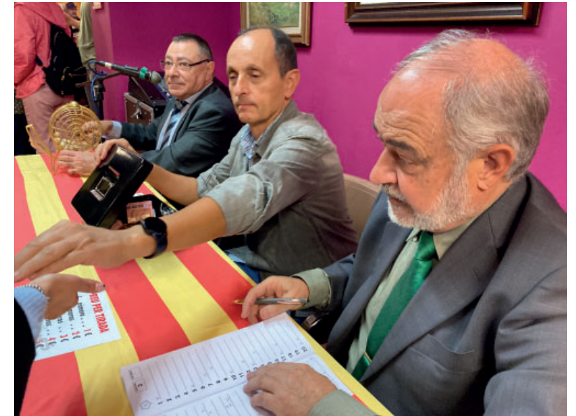
La taula on es cantaven els números amb la famosa frase: 'Va bola!'.

"Passen els anys i des del Centre d'Amics de Reus mantenim una tradició molt reusenca que no volem que es perdi, que ens enllaça amb el nostre passat i alhora crea comunitat entre els