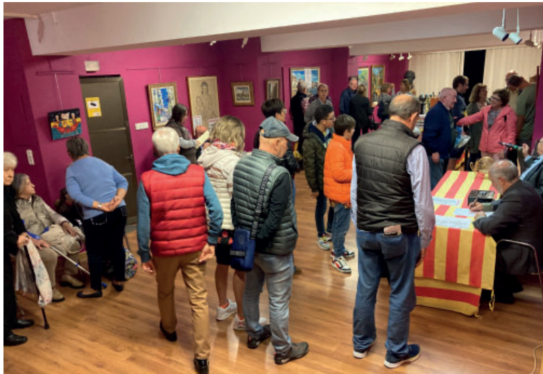
Una gernació es va aplegar a la sala La Vicaria per participar en el sorteig.

Un gran èxit de públic acompanyà una de les tradicions més pròpies del Centre d'Amics de Reus i de la ciutat per extensió. Nombrosos socis i amics es van acostar a la sala La Vicaria per sumar-se al ritual de la rifa de panellets i confitura que un any més organitzava l'entitat l'1 de novembre.