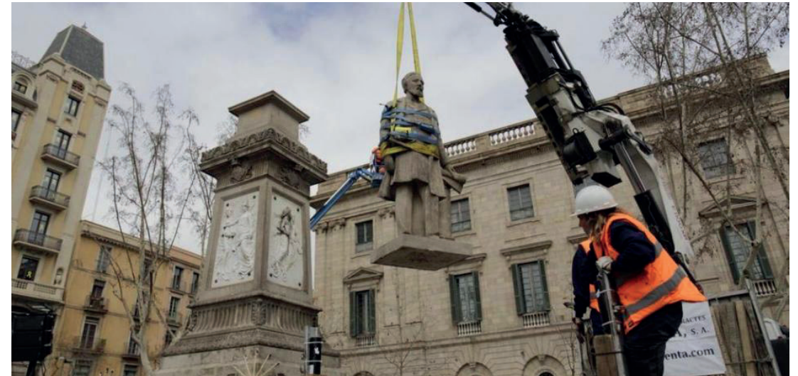
Retirada del monument barceloní dedicat a Antonio López

llibertat d'un esclau era l'import complet de cinc anys de treball d'un jornalero.