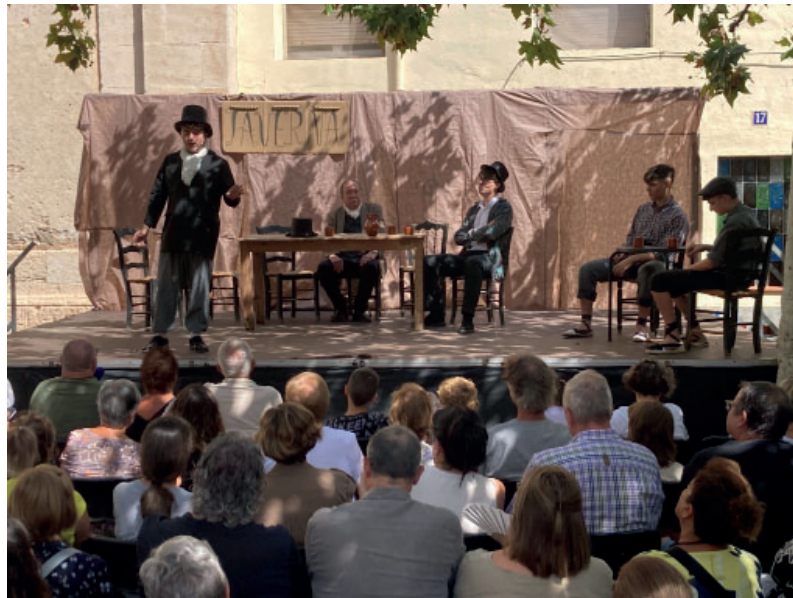
La taverna liberal va escenificar les tertúlies polítiques del moment.

Els representants del Centre d'Amics de Reus van prendre bona nota per tal de proposar de fer una visita col·lectiva a l'església per contemplar les obres de Modest Gené i l'esplendor monumental del temple, i també costar-se a l'ermita del Roser, tant estimada pels vilallonguins.