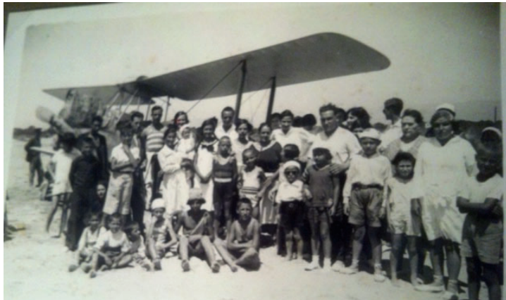
Avioneta a la Platja de Salou