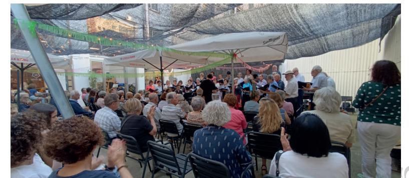
El públic va omplir la terrassa de La Mulasseta.