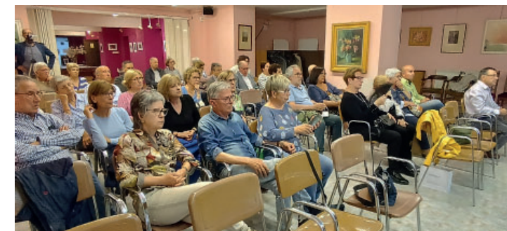
Aspecte de la sala d'actes.

voreix un consum més baix de combustible, ja que el motor ha d'arrossegar menys pes. El plàstic absorbeix molt millor els cops que no pas el ferro, cosa que, en ocasions, fa que el resultat dels accidents no sigui tan terrible.