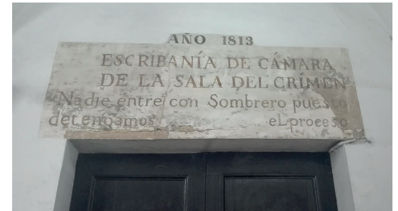
Una sorprenent inscripció

riat som l’element clau del desenvolupament del Reus Ocult, ja que hi avoquem totes les nostres energies i il·lusions per aconseguir una connexió amb el públic que demostra un interès en conèixer i descobrir racons que, malgrat poder haver-hi passat milers de vegades, els són força desconeguts, o trobar-se a persones que aporten les seves vivències, experiències o anècdotes. Tot plegat fa que, any rere any, destinem anualment un cap de setmana a fer de guies i/o acompanyants,