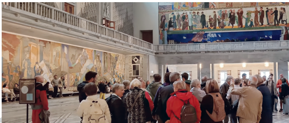
Ajuntament d’Oslo. Sala de lliurament del Premi Nobel de la Pau.

Lillehammer, ciutat seu dels Jocs Olímpics d’Hivern del 94. Al famós trampolí olímpic, coincidim amb esquiadors entrenant. Les construccions destinades a residència dels olímpics s’han reciclat en oficines. Als peus, el llac Mjøsa, que és el