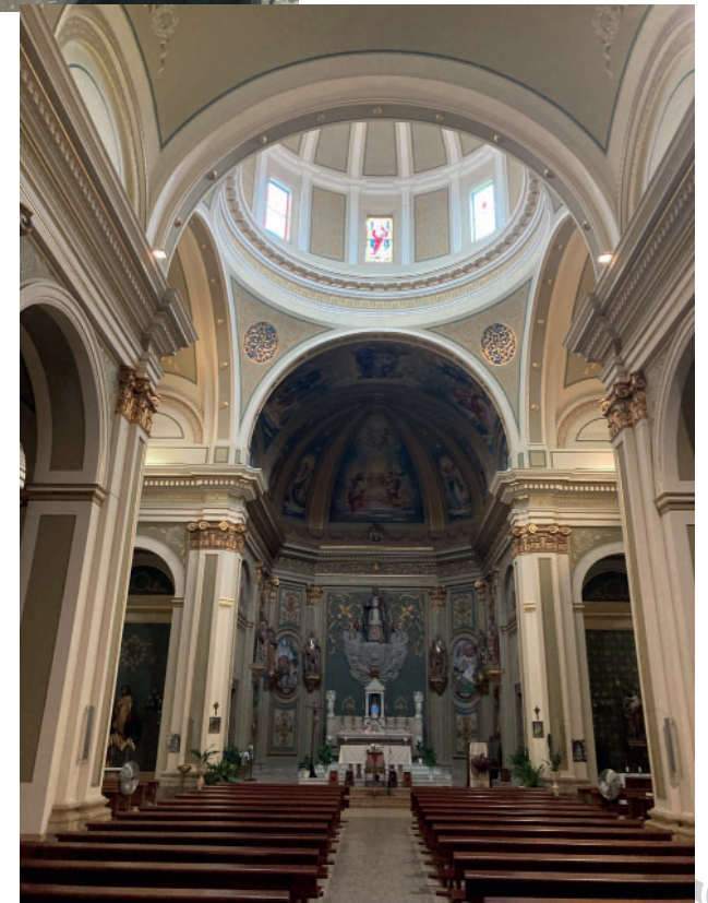
Interior de la imponent església de Vilallonga.