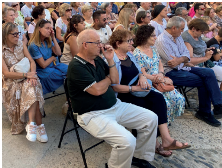
El públic va omplir a vessar els dos escenaris de la recreació, tant de matí com de tarda.

Creu damunt d'un escenari on es mostrava la vida quotidiana que es feia al carrer d'unes dones cosint i una taverna amb dos carlins despatxant negocis. Aleshores va arribar el primer batalló liberal, ferits de la batalla del Morell, que es van amagar a l'església, perseguits pels carlins, que intentaren cremar el temple per foragitar-los. Aleshores es va entablir