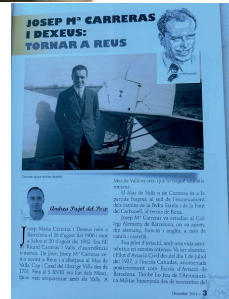
Article publicat a 'Lo Nunci' en 2013.