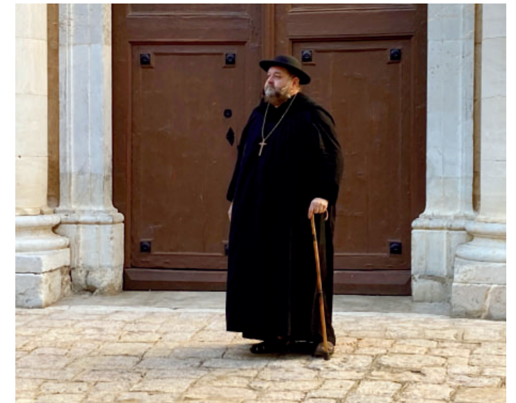
No va faltar la figura del mossèn de l'època.