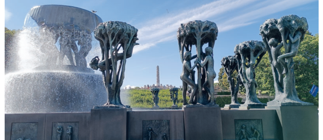
Park de Vigeland.

tòria en la Segona Guerra Mundial i la invasió dels alemanys, malgrat que Noruega era neutral.