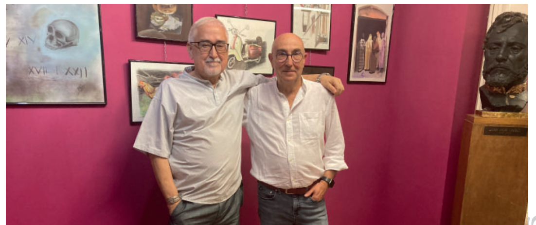
Els dos pintors, davant una sèrie d’obres.

‘Incoincidències’, aquest fou el títol elegit, va poder ser vista del 23 de setembre al 5 d’octubre. Defensen els autors la tesi segons la qual “si la realitat no coincideix amb la resposta del nostre cervell, aquest corregeix la seva percepció anterior i planteja una nova hipòtesi que torna a confrontar-se amb la realitat, fins que hipòtesi i realitat són coherents, encara que no tinguin res a veure amb la realitat objectiva”.