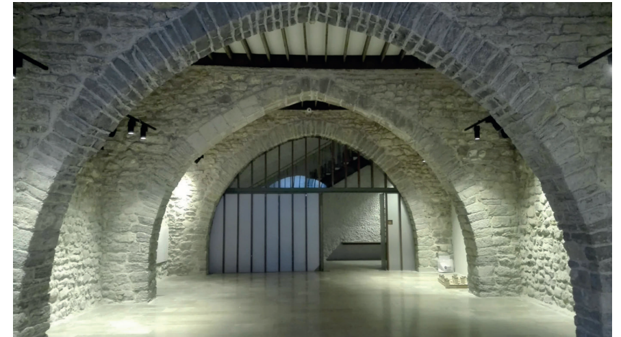
El Castell del Cambrer

Mercadal, o els dipòsits d’aigua del Pere Mata, o l’Escola Prat de la Riba, o el Centre Social del Roser, o el Centre Cultural el Castell, o la Biblioteca Pere Anguera, ... També espais vinculats a l’educació com l’Escola Prat de la Riba, o els instituts Gabriel Ferrater i Roseta Mauri, o l’Escola d’Art i Disseny de la Diputació de Tarragona, ... Alguns indrets quotidians i pú-