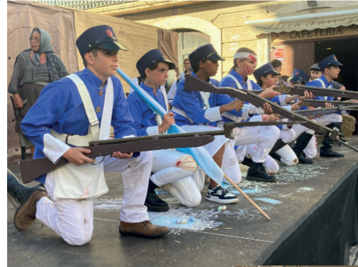
Un batalló liberal.

una nova batalla amb l'arribada d'un segon batalló liberal, amb la victòria liberal final, però a un preu global molt car.