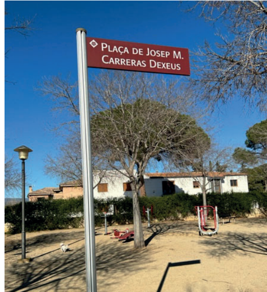
Plaça Josep M a Carreras.