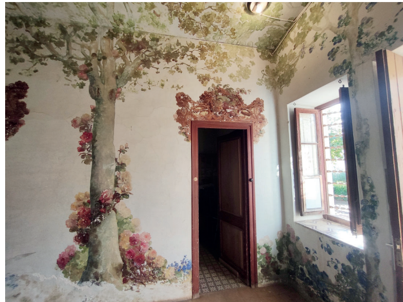
El Mas Parsifal

propietats dels indrets a ofertar, sinó que hi ha una feina “molt oculta” que està estretament vinculada a l’obtenció del finançament necessari per a poder dur a terme, any rere any, el Reus Ocult. Per tant, cal agrair les aportacions que voluntàriament dona el públic participant, però cal donar les gràcies, molt especialment, a les empreses i entitats que també fan les seves aportacions per a