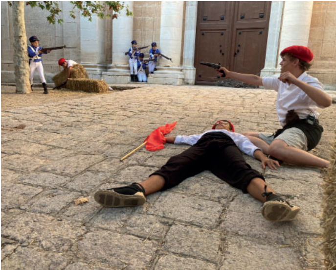
Un moment de la batalla davant de l'església de Vilallonga.

Èxit fulgurant de la tercera edició de la recreació de la Batalla de Vilallonga, celebrada el 8 de maig. Més públic que l'any passat i doble sessió de matí i tarda en comptes de representació només de tarda. La proposta d'enguany ha superat clarament el ja nombrós públic que assistí a la representació de l'any passat. El Centre d'Amics de Reus, col.laborador deb la iniciativa que comanda el Centre d'Estudis doctor Pere Virgili, va fer presència institucional tant al matí com a la tarda.