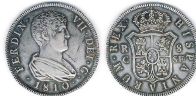
Les dates en què va funcionar la seca a Reus va tenir tres períodes diferents en funció de l'evolució de la guerra contra els francesos.

la fàbrica de moneda perquè era qui havia proporcionat la maquinària i bona part dels càrrecs i de la mà d'obra necessària per fer l'encunyació.