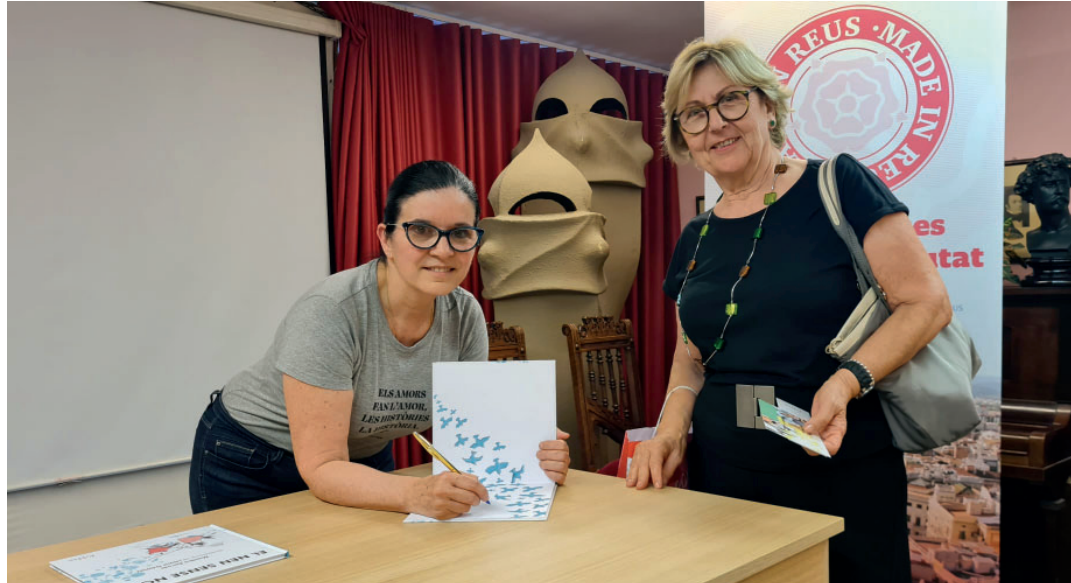
L'autora, signant llibres.