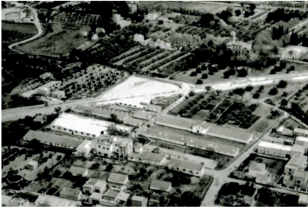
Instal·lacions de la Granja Artiga, a l'antiga avinguda de Misericòrdia.