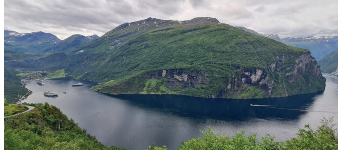
Fiord dels Somnis.

Sense pietat, sense respecte per l'edat, que per això a ningú se li nota, a les 3 de la matinada, tothom en marxa.